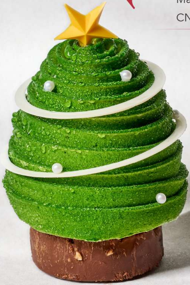
抹茶莓果蛋糕 Matcha Berries Delight CNY 78 / 个 Piece