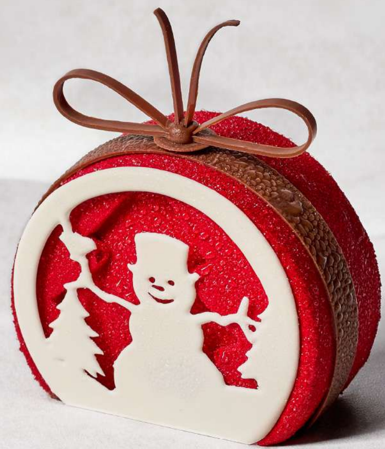
肉桂红酒梨蛋糕 Cinnamon Red Wine Pear Delight CNY 78 / 个 Piece