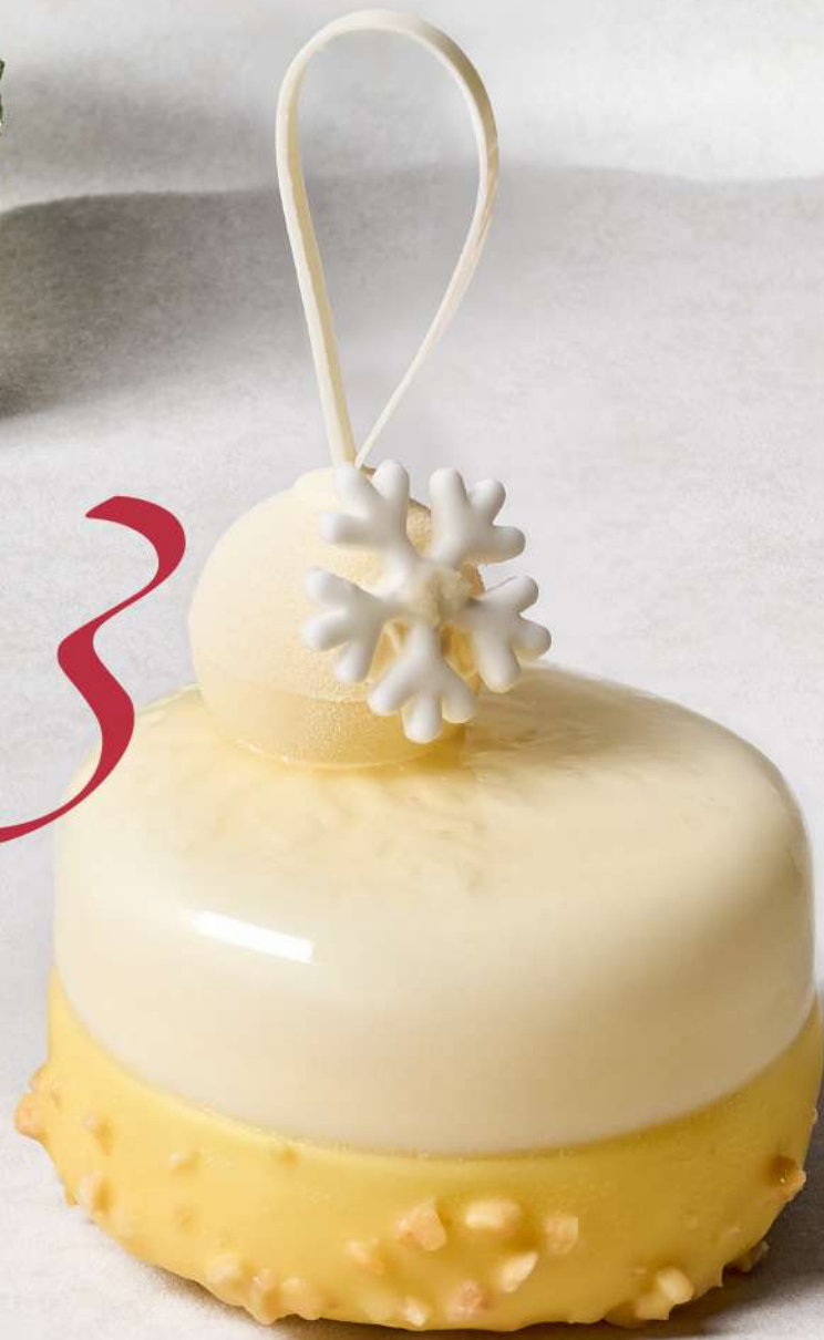
柑橘松子蛋糕 Citrus Pine Nuts Cake CNY 78 / 个 Piece